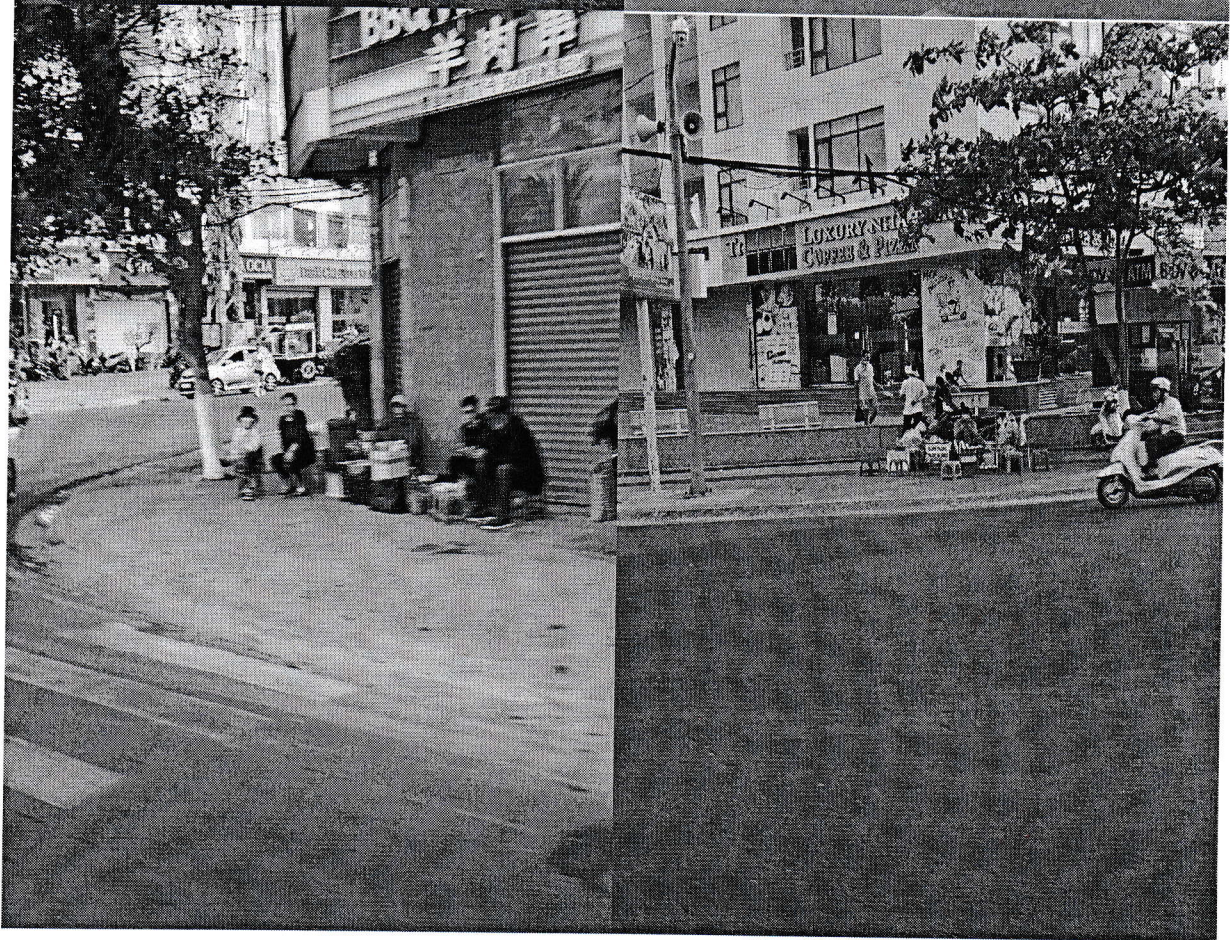
Buôn bán hàng rong, hàng dạo di chuyển sang ngã ba, đường ngang nối với đường Phạm Văn Đồng