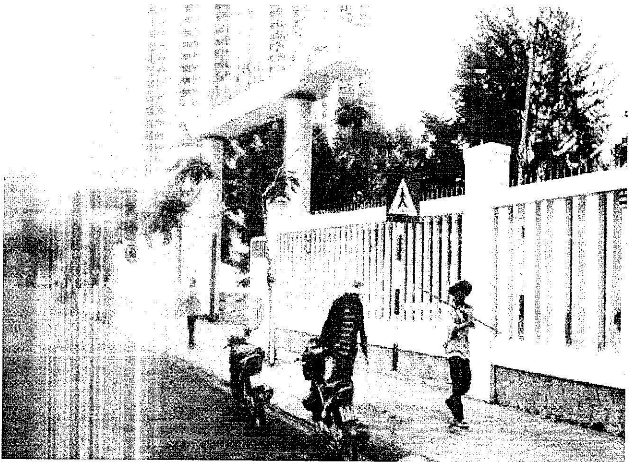
Biển báo trên đường Dương Hiến Quyền, đoạn giáp đường Mai Xuân Thưởng đã được khắc phục